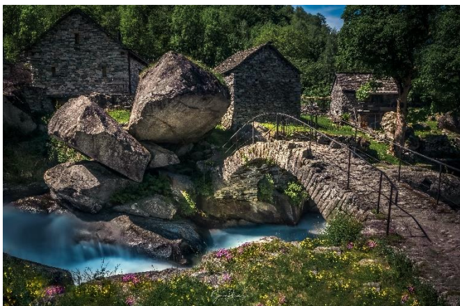
Puntid, Val Calneggia/Bavona