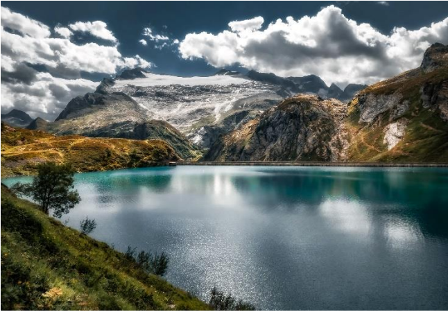
Lago Robiei, Ghiacciaio del Basodino, Val Bavona