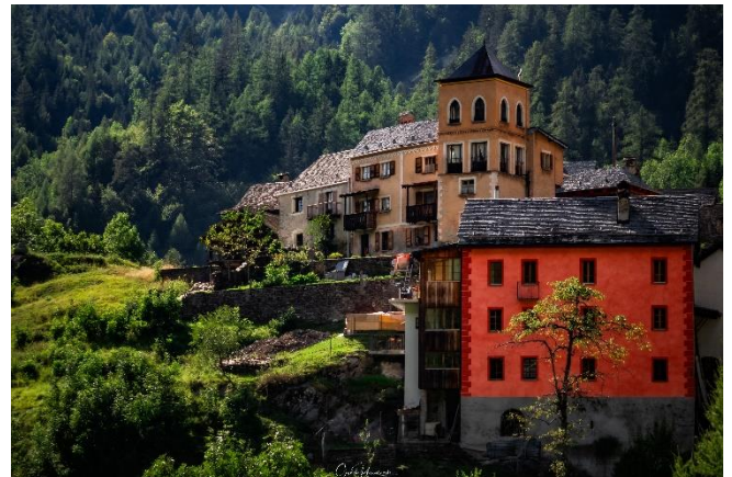
Fusio, Vallte Lavizzara