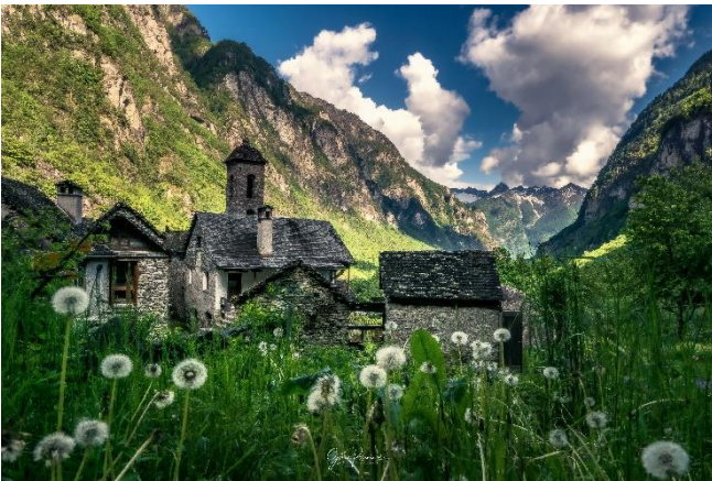
Foroglio, Val Bavona