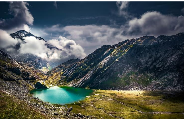
Lago Bianco, Robiei, Val Bavona