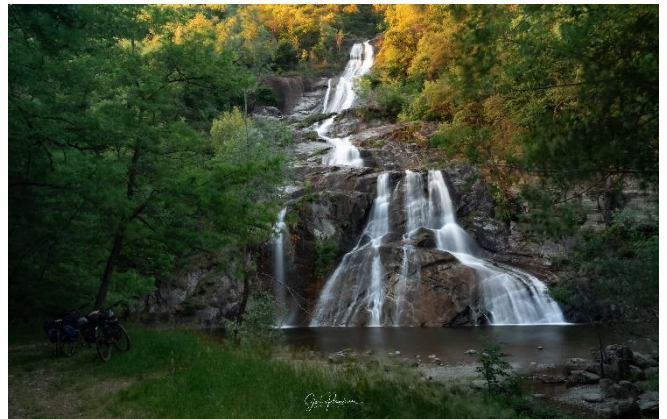
Cascata delle Sponde, Vallemaggia