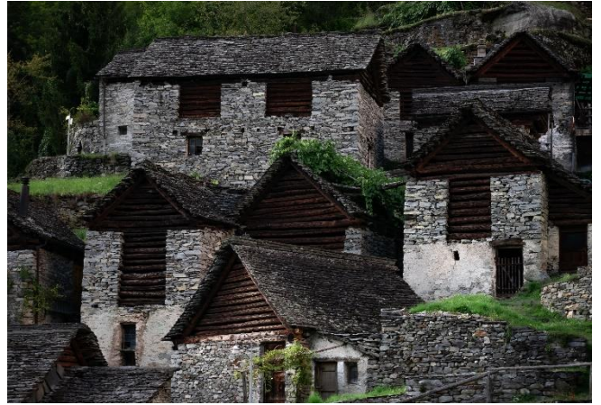
Brontallo, Valle Lavizzara