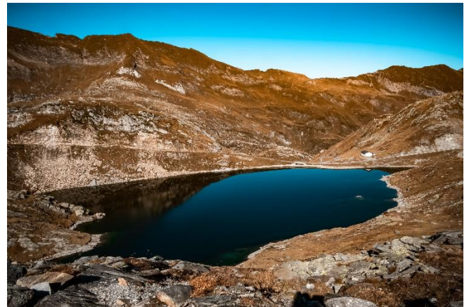
Lago Scuro, Naret, Valle Lavizzara