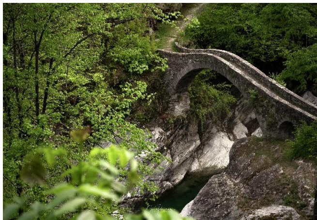
Ponte della Merla, Valle Lavizzara