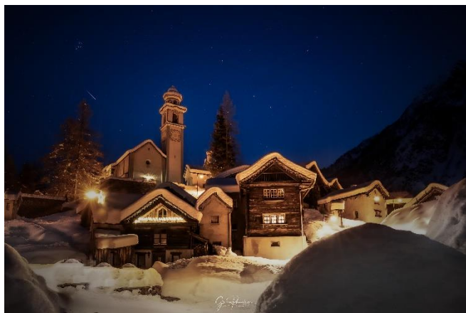
Bosco Gurin, Val Rovana