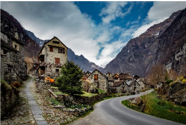
Sonlerto, Val Bavona